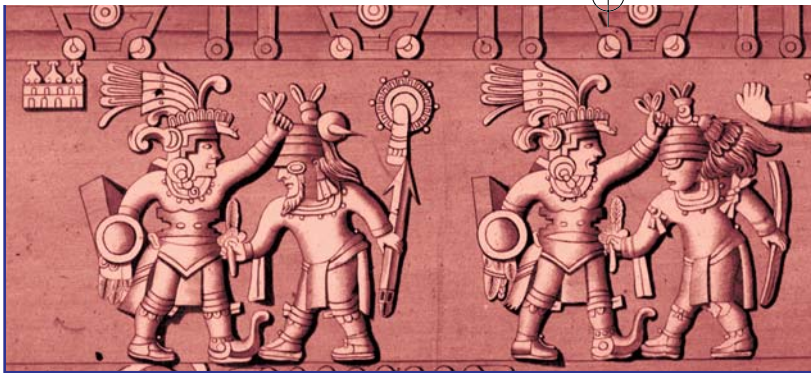
Jáspisból készült azték dombormű

ját Kristályszentélyére, ami az ébredés szakaszainak tudatos átélését, megta- pasztalását is jelenti.