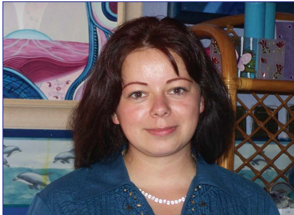
A kristályok eredendően, a puszta jelenlétükből adódóan csodálatos adományai a Földanya testének.

hogy a delfinek, bálnák, különböző csillagbolygók magasabbrendű szellemi lényeknek, tanítóinak és gyógyítóinak a fizikai, testet öltött mesterei, akik minden élőlény, az emberek és a Földanya segítségére jöttek ide. Telepatikusan kommunikálva, ébrenlétben vagy álomban, különböző fénymagokat, csillagkódokat ébresztenek bennünk, a csecsemőmirigy és a szívcsakra területén, hogy a belső Lélek-kristályunk darabjai, újra egybeforranak, és a Szívtemplomunk Kristályszentélye újra éledve, megszólaljon a fénydimenziók halk hívásaira.